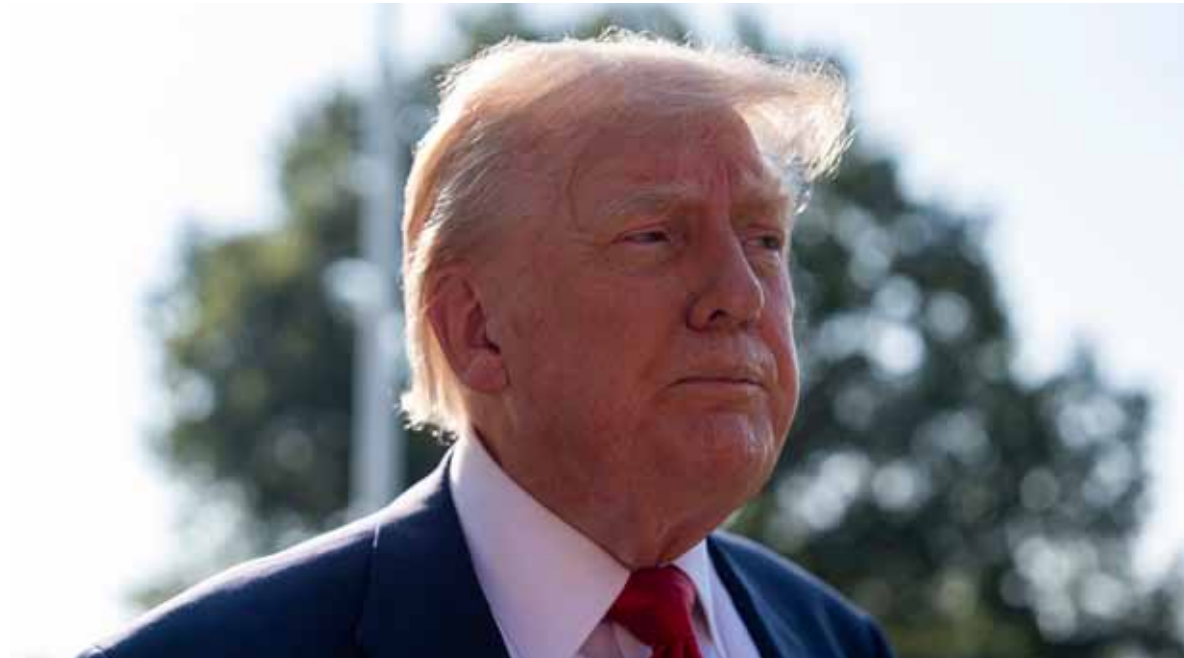
Postura firme. El líder republicano indicó que el movimiento islamista "va a tener que luchar".

"Siempre he dicho que esos últimos 10 o 20 (rehenes) serán los más difíciles, porque Hamás sabe lo que pasará cuando no tenga una moneda de cambio, y realmente rompieron el acuerdo. Rompieron