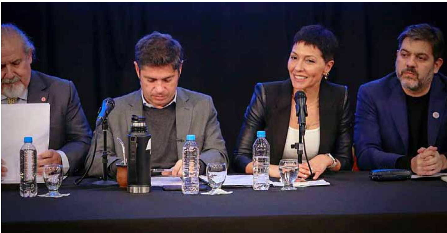
■ Sonrisas de Mayra Mendoza en el encuentro en que apareció junto al gobernador Axel Kicillof.

tenso cierre de listas del fin de semana pasado. El hecho se produjo en el marco del Encuentro Bonaerense de Ciencia y Universidad, que se desarrolló en Quilmes, del que también participó la vicegobernadora Verónica Magario. Página 2