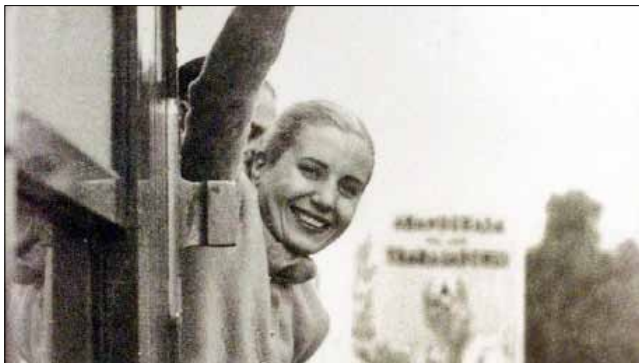
Eva Duarte de Perón

1928 - nació Stanley Kubrick, cineasta estadounidense y director de