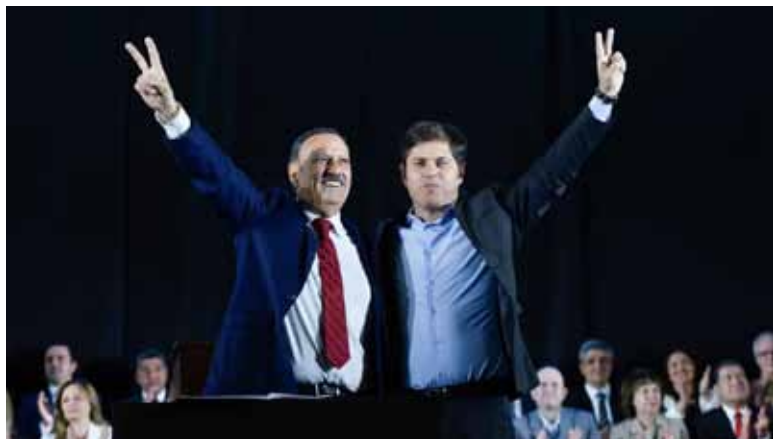
Diferencias. De Ricardo Quintela y Axel Kicillof

En total, serán 18 los diputados renovar sus bancas en suelo riojano. ///