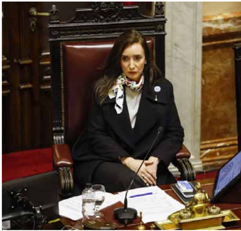
Aislada. Desde el gobierno dicen que Villarruel "no forma parte" del proyecto

Villarruel viene de desplegar una ola de respuestas en su cuenta de Instagram tras ser rotulada de "traidora" después de las derro-