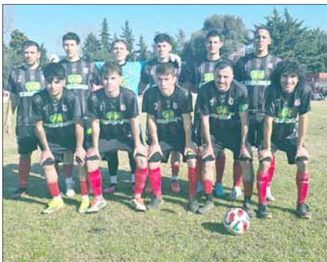
Los "gallegos" lideran ambas divisiones.

En Daireaux: Bancario vs. Balonpié. 13 horas Reserva y 15 horas Primera división.