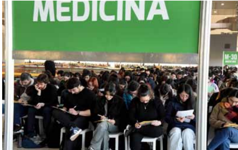
A rendir de nuevo. Si en el oral el profesional confirma sus conocimientos, se mantendrá la nota.

Después que el Ejecutivo comunicara que los médicos que sacaron por encima de 86 puntos en el examen tienen que volver a rendirlo, se generó conmoción y preocupación entre aquellos profesionales que estudiaron durante