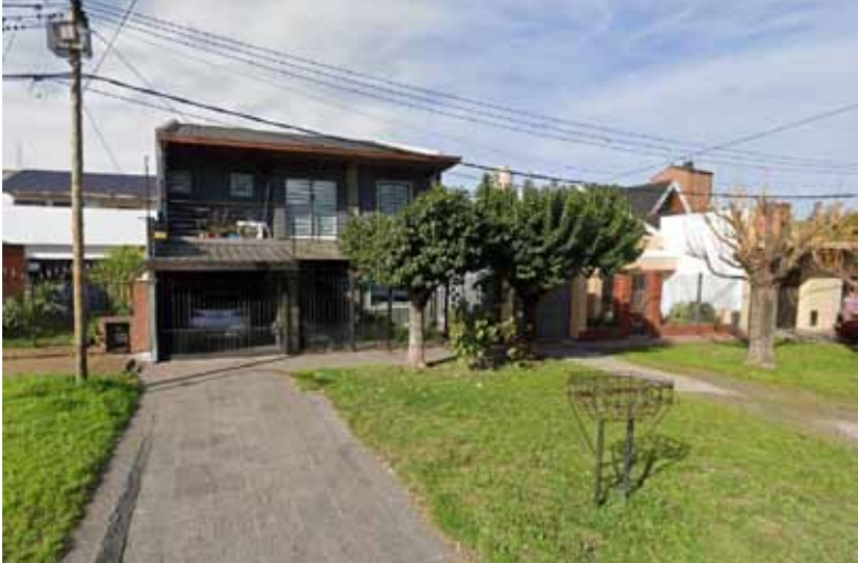
El homicidio. Ocurrió en una casa ubicada en el límite entre Bernal y Quilmes Oeste

El homicidio fue perpetrado durante la madrugada del jueves,