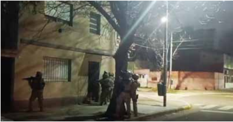
El operativo en el que se logró detener al cabecilla de la banda.

El hecho que sirvió de disparador para seguir las huellas del grupo delictivo ocurrió el 19 de diciembre de 2024, cuando la víctima, un hombre de 60 años, fue sorprendida dentro de su vivienda por tres delincuentes. Tras forcejear y gritar pidiendo auxilio, los asaltantes huyeron con elementos de valor, dejando al propietario encerrado. Se constató que los accesos no habían sido violentados, lo que indicó que los autores ingresaron