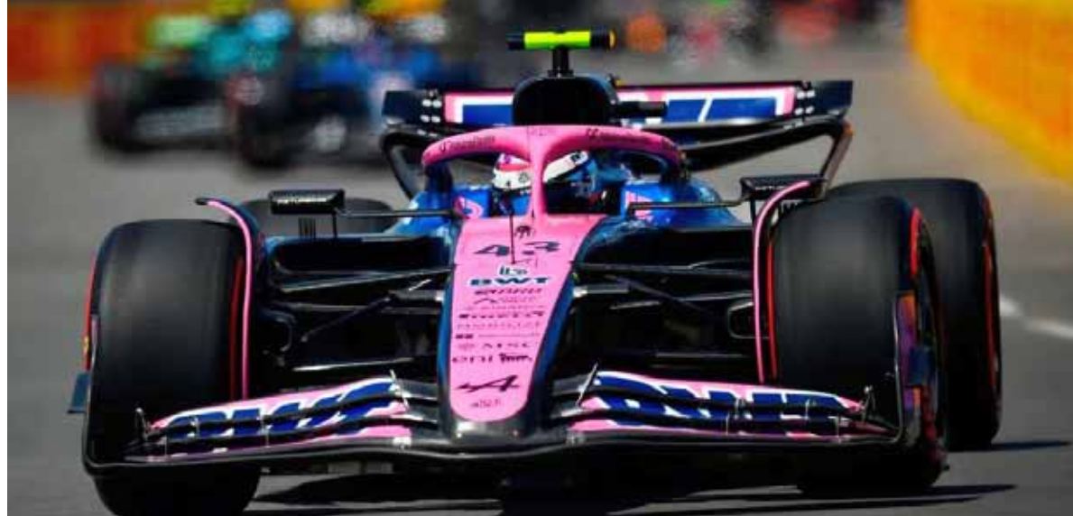
Floja actuación. Del argentino Franco Colapinto

El argentino, que realmente está teniendo una temporada realmente para el olvido, venía de terminar en la misma posición en la práctica libre, sin sentirse para nada cómodo en el histórico cir-